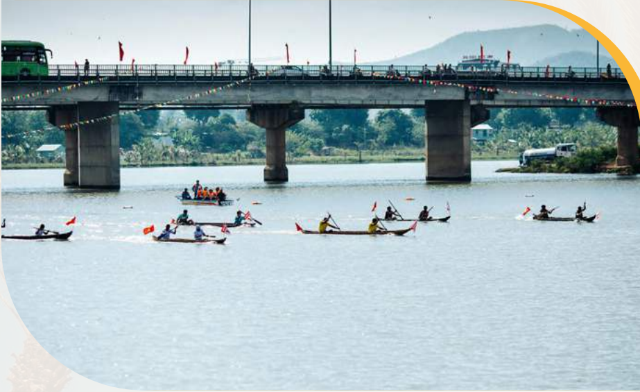
The Training Gangipawis.com

بالنسبة للفعاليات الصغيرة، حيث قد يحضر العديد من أفراد القوى العاملة في يوم الفعالية فقط، ينبغي على مديري الفعاليات الاستعداد لتقديم إحاطات شفوية حول أي جوانب بيئية رئيسية يجب أن يكونوا على علم بها وتوزيع نشرات معلومات مبسطة تتضمن النقاط الرئيسية ومن يجب الاتصال به في حال وجود أي مشكلة.