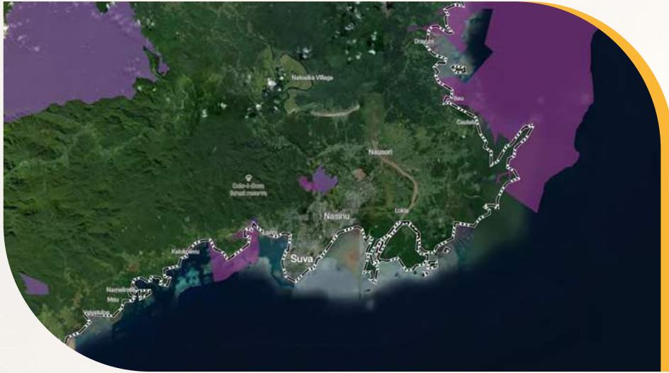
لقطة شاشة لمختبر الأمم المتحدة للتنوع البيولوجي تُظهر المناطق المحمية حول سوفي، فيجي