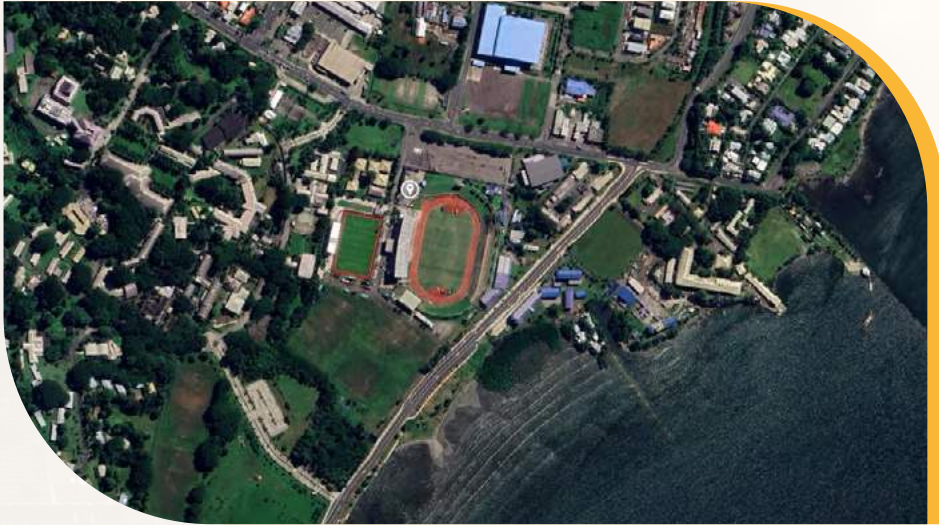
لقطة شاشة من خرائط غوغل لمكتب الاتحاد الدولي لحفظ الطبيعة في فيجي وملعب الرجبي المجاور له.

تذكر أنه على الرغم من أن المواقع الفردية قد تكون ذات قيمة جوهريّة محدودة للطبيعة، إلا أنها عندما تشكل جزءاً من سلسلة أكبر ومتراصة من المواقع والمساحات الخضراء، فإن قيمتها الجماعية يمكن أن تكون أكبر بكثير من قيمة الأجزاء الفردية. لذلك، احرص دائماً على فهم كيفية اندماج مكان فعاليتك ضمن سياق محلي أوسع. هذا مهم بشكل خاص في المناطق الحضرية حيث توفر المرافق الرياضية في كثير من الأحيان روابط خضراء بين بقعة وأخرى من المساحات الخضراء أو الممرات المائية، مما يساهم في إنشاء شبكة مترابطة من المواقع التي تُضيف قيمة كبيرة للطبيعة بشكل تراكمي.